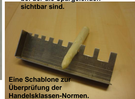
Eine Schablone zur Überprüfung der Handelsklassen-Normen.