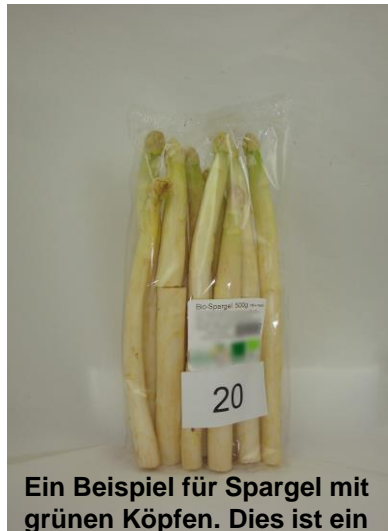
Ein Beispiel für Spargel mit grünen Köpfen. Dies ist ein Zeichen für eine lange Lagerung im Licht.