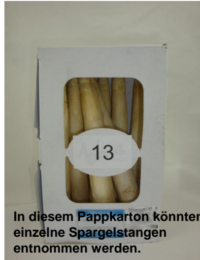
In diesem Pappkarton könnten einzelne Spargelstangen entnommen werden.