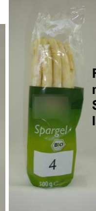
Für Verbraucher nicht erkennbar: Der Spargel ist 2 cm zu lang.