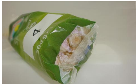
Durch diese Folienverpackung ist der Spargel kaum sichtbar.