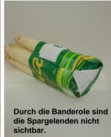
Durch die Banderole sind die Spargelenden nicht sichtbar.