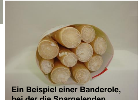
Ein Beispiel einer Banderole, bei der die Spargelenden sichtbar sind.