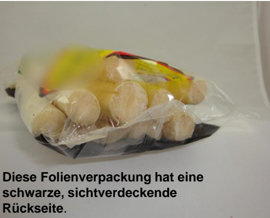
Diese Folienverpackung hat eine schwarze, sichtverdeckende Rückseite.