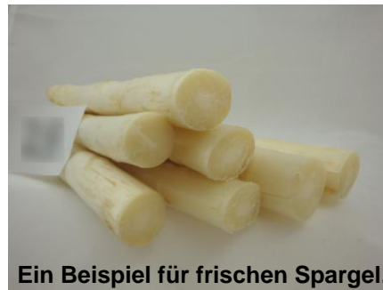
Ein Beispiel für frischen Spargel.