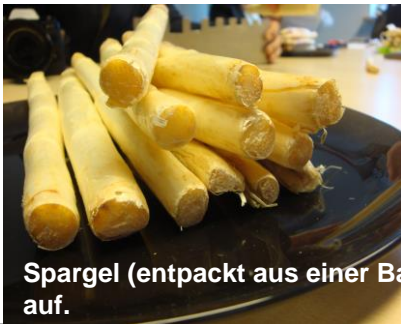
Spargel (entpackt aus einer Banderole) weist holzige Enden auf.